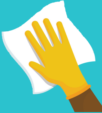
قطعة قماش من الألياف الدقيقة (ميكروفايبر)

استخدم الماء أو أحد منتجات التنظيف الأقل سميةً لتنظيف معظم الأسطح.