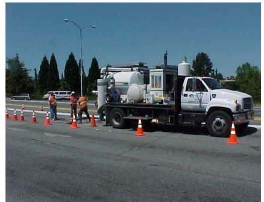
例：用於公共設施定位的真空挖掘機

施工期間，在“坑洞勘探”附近的車道、單車道及人行道將被關閉。請遵循交通指揮員的指示安全地通過此地區。