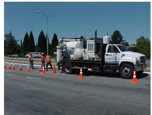
Ejemplo de una excavadora de vacío utilizada para la colocación de servicios públicos.

King County WTD está diseñando una nueva tubería de alcantarillado para reemplazar una ya existente que corre bajo Coal Creek Natural Area. La tubería existente de 2.5 millas de largo brinda servicio a Bellevue y