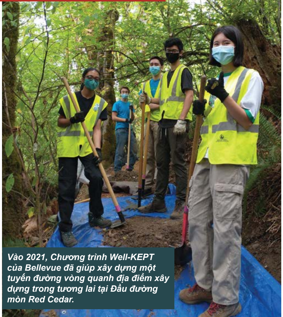
Vào 2021, Chương trình Well-KEPT của Bellevue đã giúp xây dựng một tuyến đường vòng quanh địa điểm xây dựng trong tương lai tại Đầu đường mòn Red Cedar.

Bản đồ ở trang 2-3 cho một cái nhìn tổng thể về các khu vực làm việc với các điểm nổi bật. Truy cập trang web của dự án để thấy tham quan trực tuyến với nhiều thông tin chi tiết hơn. Trang 4 bao gồm thông tin để bạn có thể liên lạc với nhóm chúng tôi nếu có bất kỳ câu hỏi hay quan ngại nào.