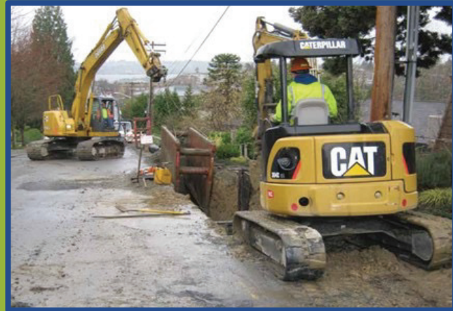
مؤذج لطواقم كينغ كاونتي وهم يقومون بعمليات الحفر قبل تركيب أنبوب صرف صحي تحت الشارع.