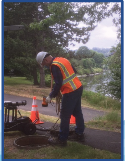
قد تشاهدون فرق العمل التابعة لمقاطعة كينغ كاونتي وهم يفحصون خطوط الصرف الصحي في الحي الذي تسكنون فيه. لا غنى عن هذه الأعمال لحماية الصحة العامة والحفاظ على نظافة المياه.

金郡現正展開一個項目，為您鄰近地區的4.5哩污水管進行升級。請前往 kingcounty.gov/KCRedmondsewer 瀏覽本項目的中文資訊。如有疑問，請致電 206-477-8621 聯絡 Kelly Foley Kruse。您將獲派一位傳譯員免費為您服務。