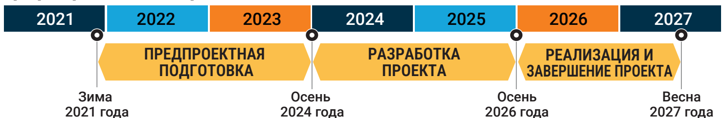
График реализации проекта

Трубопровод M Street ветшает и требует восстановления, чтобы предотвратить перелив, повреждение и другое нарушение работы канализации, которое может привести к негативным последствиям для окружающей среды и здоровья населения.