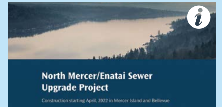
在 kingcounty.gov/MercerEnataiSewer 在線找到我們