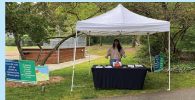
工作人員在 Bike Everywhere Day 舉辦展位。