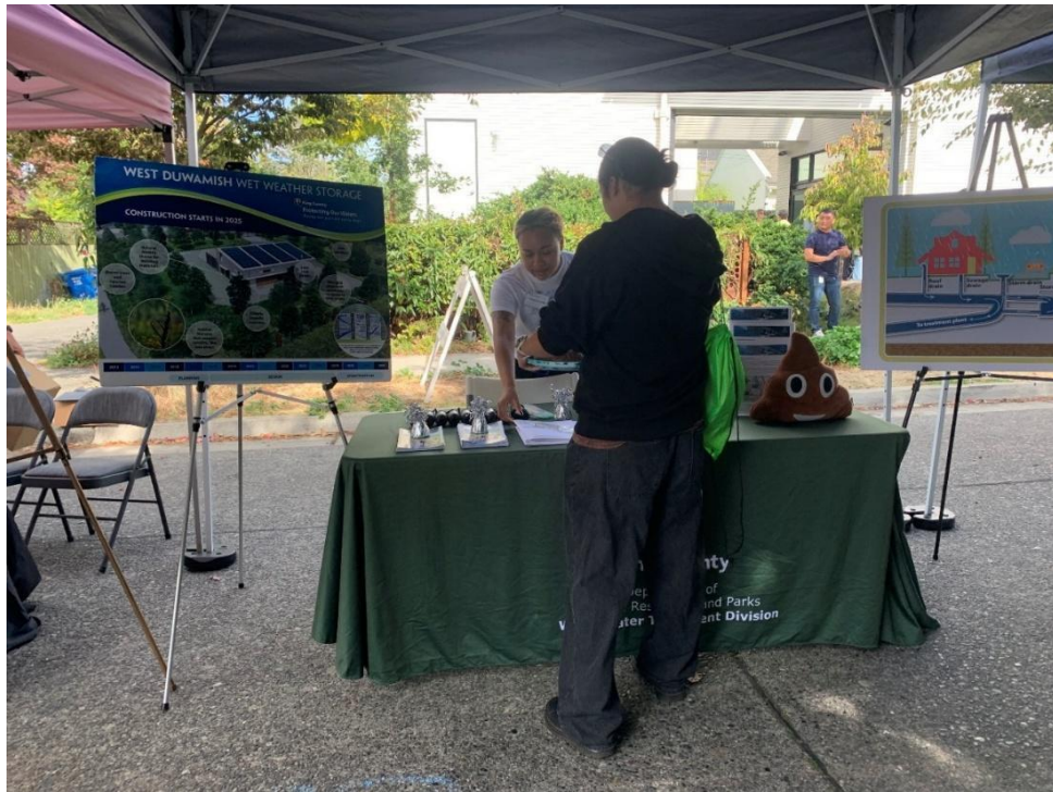
El equipo del proyecto en la celebración del Duwamish Valley en Georgetown en septiembre de 2025.