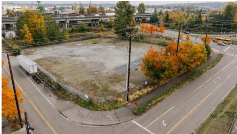
Sitio de la instalación antes de la construcción (octubre de 2025)

Este año, King County involucró a empresas, residentes y socios comunitarios para prepararse para la construcción. Comenzaremos a construir un tanque de almacenamiento subterráneo a principios de 2026. Estará cerca de la intersección de Southwest Michigan Street y Second Avenue Southwest en South Park. El tanque de almacenamiento retendrá aguas pluviales y aguas residuales durante tormentas intensas, lo que ayudará a mantener la contaminación fuera del Duwamish River.