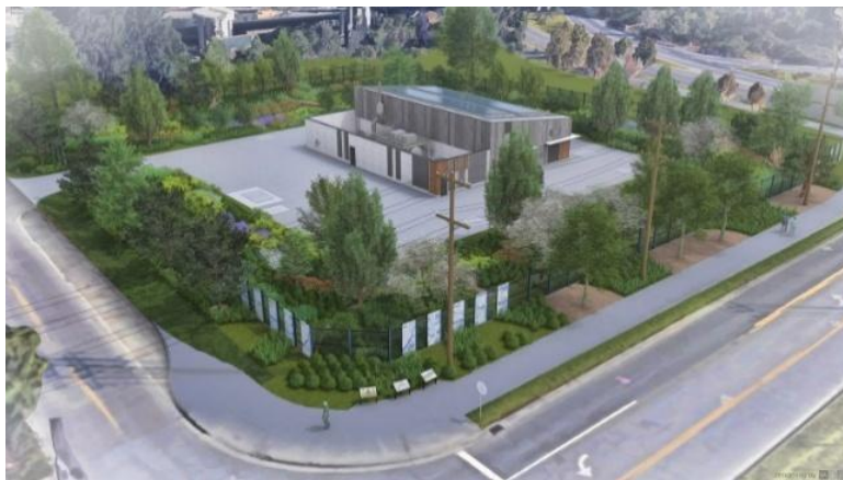
Representación de la instalación una vez finalizada la construcción