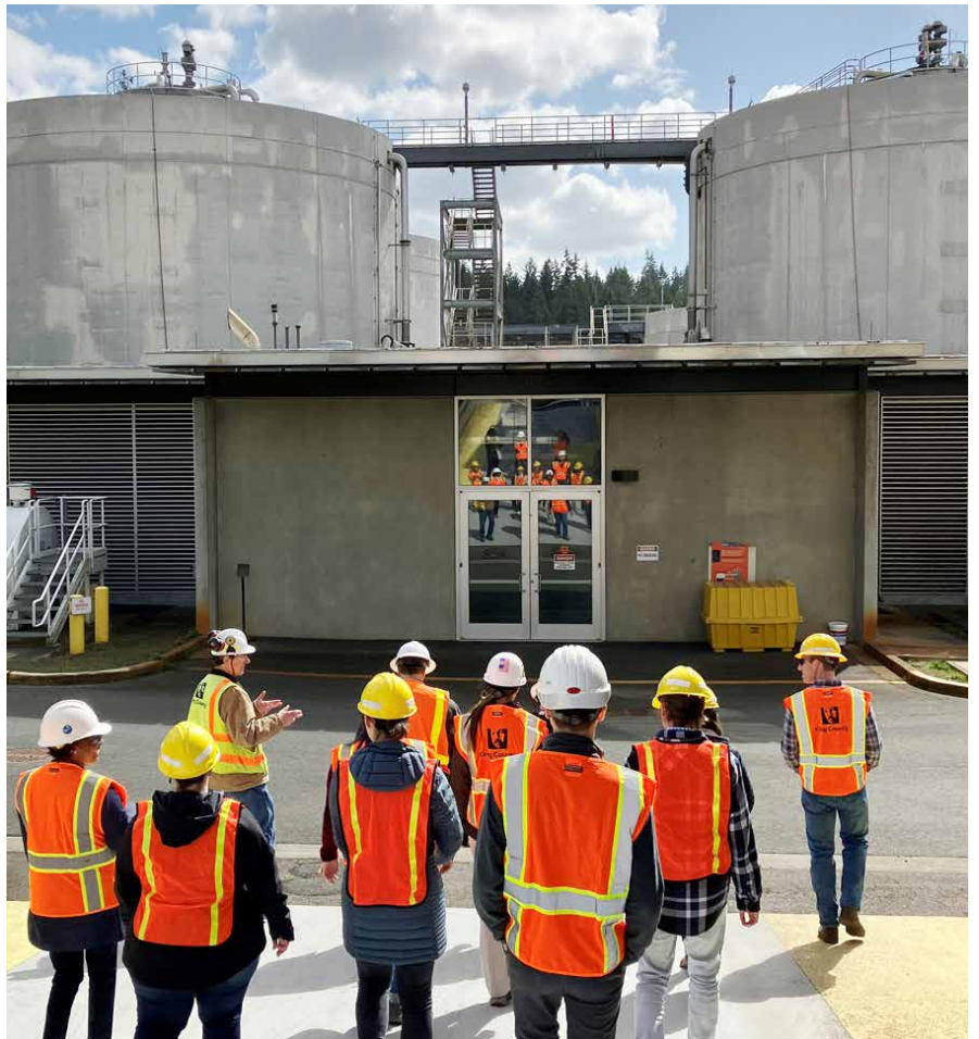
一位金縣工程師在參觀 Brightwater 處理廠時描述了沼氣池在廢水處理過程中的作用。