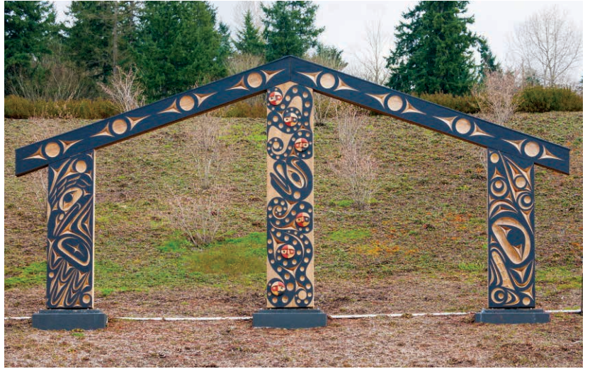
© 2023 Andrea Wilbur-Sigo. Grandfather's Wisdom (Мудрость Деда). Из Публичной коллекции искусства округа King.

Во время прогулки на территории Brightwater вы можете заметить множество работ публичного искусства, созданных под влиянием местных общин. Вы можете заметить, что длинный дом, который является частью композиции Grandfather's Wisdom (Мудрость Деда) отсутствует в Южной части зоны мокрого ландшафта. Это впечатляющее произведение искусства оживляет историю, перспективу и культуру народа Coast Salish для посетителей Brightwater. Скульптор Andrea Wilbur-Sigo реставрирует длинный дом, чтобы улучшить шансы долгого существования скульптуры на открытом воздухе. Мы ожидаем, что обновленный длинный дом вернется на свое место в конце этой весны. Узнайте подробности: 4culture.org/public_art/grandfathers-wisdom/