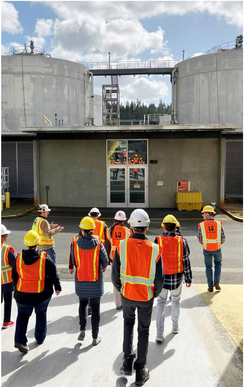
На экскурсии Водочистительной Станции Brightwater инженер округа King описывает роль метантенков в процессе очищения воды.

King County Metro Community Van – это программа совместного использования транспорта, которая помогает членам общин совместно использовать заранее организованные поездки до местных пунктов назначения таких как Brightwater. За более подробной информацией посетите вебсайт King County Metro или позвоните местному координатору по телефону 425-352-5129 (мы предоставляем бесплатных переводчиков). kingcounty.gov/communityvan