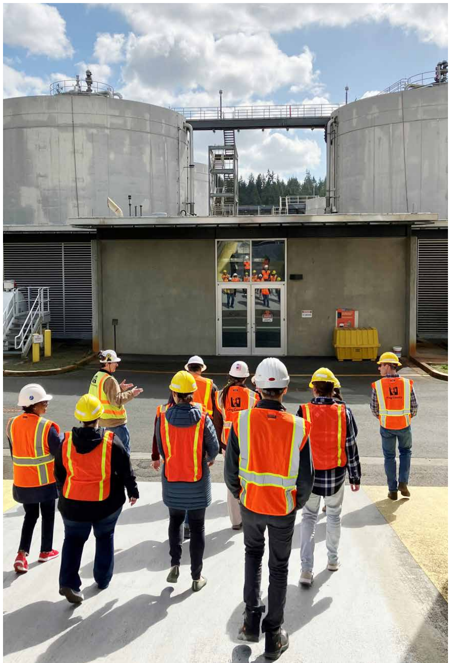
Un ingeniero del condado de King describe el papel de los digestores en el proceso de tratamiento de aguas residuales durante un recorrido por la planta de tratamiento de Brightwater

El King County Metro Community Van es un programa de viajes compartidos que ayuda a que los miembros de la comunidad a compartan viajes programados con anticipación a destinos locales como Brightwater. Para obtener más información, visite el sitio web de King County Metro o llame a su coordinador local al 425-352-5129 (se cuenta con interpretación gratuita disponible). kingcounty.gov/communityvan