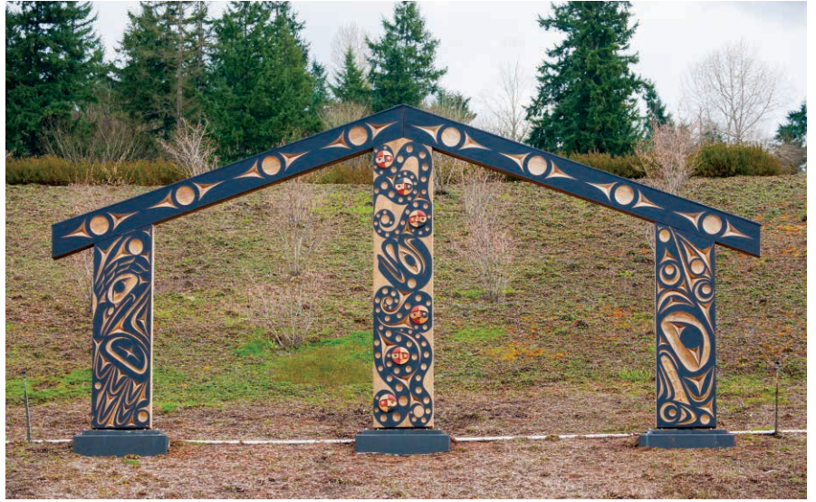
Grandfather's Wisdom. De la colección de arte público del condado de King