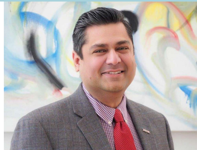
Dr. Faisal Khan, Director of Public Health — Seattle & King County

Наш департамент не був застрахований від десятиліть недостатнього фінансування, через що національна система охорони здоров'я виявилася недостатньо підготовленою для захисту здоров'я жителів округу Кінг. Нещодавні федеральні інвестиції та інвестиції від уряду штату в інфраструктуру охорони здоров'я та основи послуг охорони здоров'я є втішними та важливими кроками, але існує потреба у звищеному, гнучкому та надійному фінансуванні, щоб уникнути повернення до історичних циклів буму та спаду у фінансуванні охорони громадського здоров'я.