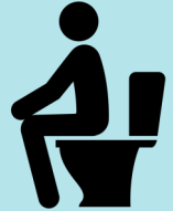
ድሕሪ ምጥቃም ሸንት ቤት