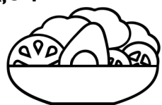
ጥረ ኣሕምልትን ፍረታትን

እዚሓም መግብታት ብባክተርያ ኢ. ኮላይ (E.coli) ከም እተበከሉ ይፍለጥ እዩ። ጥረ መግብታት ኣጸቢቕኻ ምሕጻብን፣ ምብሳልን፣ ስግራ-ብከላ ምእንቲ ኸይህሉ ድማ ንኹሉ ሓደገኛ ዝኸፍኑ መግብታት ካብ ካልእ ምግብ ምፍላይ .