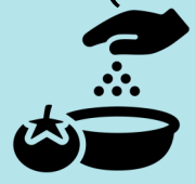
ምግብ ቅድሚ ምድላውኩም