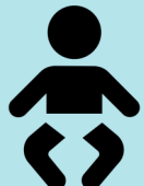
ድሕሪ ዳያፐር ምቕያርኩም