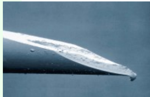
Punta de jeringa utilizada dos veces