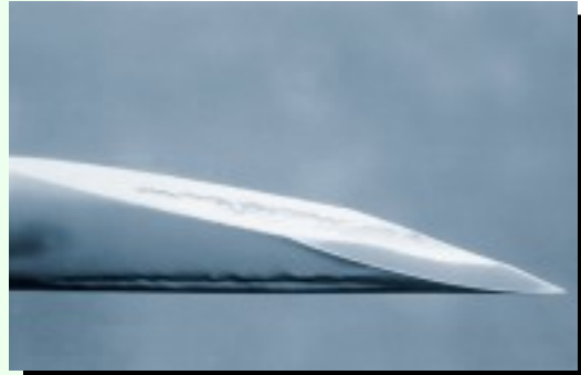
Punta de jeringa nueva

Utiliza una jeringa nueva CADA VEZ que te inyectas la piel o la vena