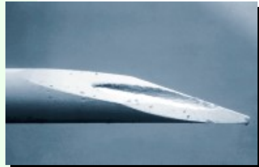
Punta de jeringa utilizada una sola vez