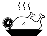
올바른 온도로 조리하십시오