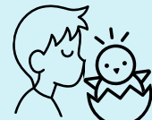
동물과의 키스 또는 접촉, 동물의 대변이나 주변 환경 접촉.