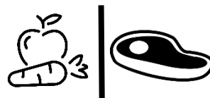
조리되지 않은 육류는 과일 및 채소와 분리하십시오