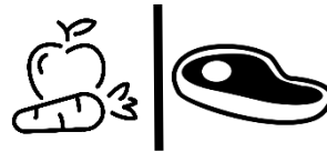
Bảo quản thịt sống cách xa hoa quả và rau củ