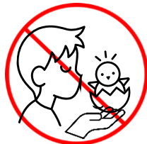
Không hôn động vật