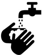
Rửa sạch tay và các bề mặt cơ thể thường xuyên