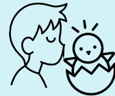
Hôn hoặc chạm vào động vật, phân động vật hoặc môi trường sống của động vật.