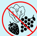
ሊላጡ የማይችሉ ፍራፍሬዎችንና አትክልቶችን አይብሉ።