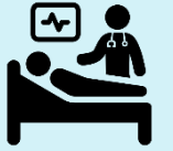
الأشخاص الذين يعانون من ضعف الجهاز المناعي