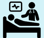
کمزور جسمانی مدافعتی نظاموں کے حامل افراد جسمانی دفاعی نظام

میں اس سے دوسروں کو متاثر ہونے سے کیسے بچا سکتا ہوں؟