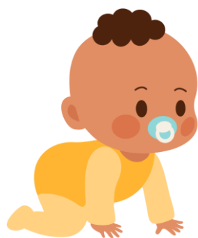
Niññin im ajiri ro redik

Armej ro jen aolep yiiō remaroñ bōk wā ñan kōjbarok ir māke im ro jot.