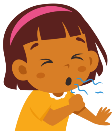
pokpok ko relap

Pokpok edep, ej bar nae etan pertussis, ej walok jen kij ko rej ajeeded jen armej ñan armej ilo mejatoto. Jot kakōlle ej: