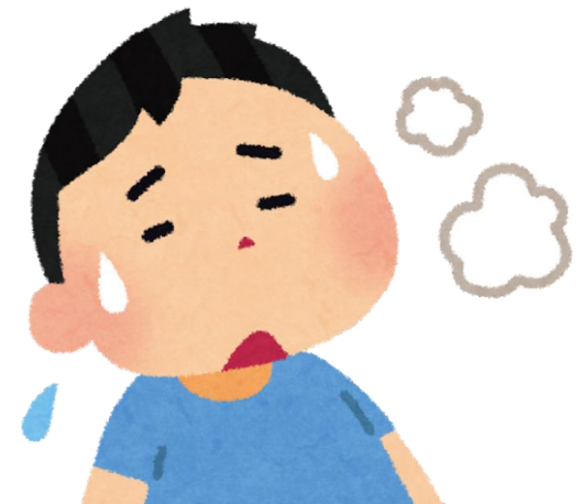
ਸਾਹ ਲੈਣ ਵਿੱਚ ਮੁਸ਼ਕਲ