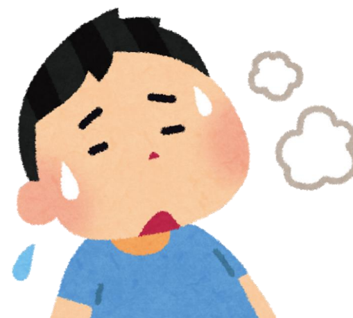
neefsasho dhib ah