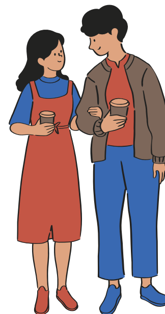
Personas de 19 años en adelante