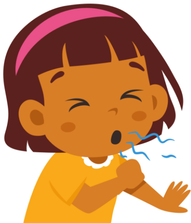
ናይ ሰዓል ምጥቃዕ

ብርቱዕ ሰዓል፡ ብፐርቱሲስ ዝፍለጥ፡ ካብ ሰብ ናብ ሰብ ኣብ ኣየር ብዝዝርጋሕ ባክተርያ ዝመጽእ እዩ። ገለ ምልክታት ድማ፡