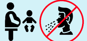
ਬੱਚਿਆਂ ਅਤੇ ਗਰਭਵਤੀ ਔਰਤਾਂ ਦੇ ਨੇੜੇ ਜਾਣ ਤੋਂ ਪਰਹੇਜ਼ ਕਰੋ