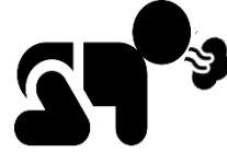
ਸਾਹ ਲੈਣ ਵਿੱਚ ਤਕਲੀਫ਼