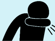
ਖਾਂਸੀ ਕਰਨ ਵੇਲੇ ਮੂੰਹ ਨੂੰ ਕੂਹਣੀ ਜਾਂ ਟਿਸ਼ੂ ਨਾਲ ਢੱਕੋ