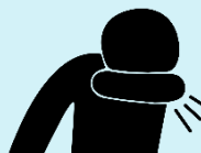
Cúbrase la boca al toser con el codo o un pañuelo