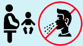
Evite estar cerca de bebés y de personas gestantes