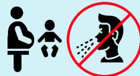
Тримайтеся подалі від немовлят та вагітних жінок