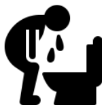
Блювання після кашлю