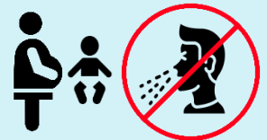
Tránh xa trẻ sơ sinh và phụ nữ có thai