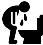
Nôn mửa sau khi ho