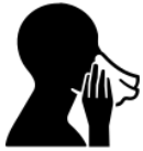
Chảy nước mũi

Đây là bệnh gì? Ho gà là bệnh gây ra bởi vi khuẩn và khởi phát sau 5-21 ngày tiếp xúc với mầm bệnh. Ban đầu, triệu chứng bệnh có thể giống như bị cảm lạnh. Sau đó cơn ho sẽ trở nên nặng hơn. Bệnh nhân có thể ốm trong nhiều tuần. Một số dấu hiệu bệnh: