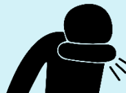
Che miệng bằng khuỷu tay hoặc khăn giấy khi ho