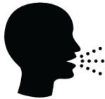
Ho trầm trọng hơn