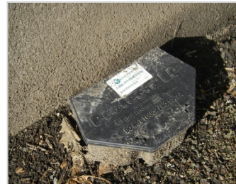
미끼집 또는 "미끼 상자"

쥐약은 어린아이와 애완동물로부터 보호하기 위해 항상 안전한 미끼집을 이용해 사용해야 합니다. 설명서의 지시에 따라서만 사용합니다.