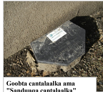
Goobta cantalaalka ama "Sanduuqa cantalaalka"

Waa in mar kasta la isticmaalo sunta doonliga meelaha cantalaalka ee sugan si looga fogeeyo caruurta iyo xoolaha guriga jooga. U isticmaal oo keliya sida waafaqsan filmaamaha ku yaal calaamadda.