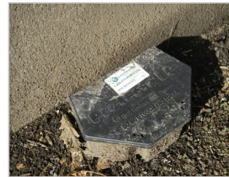
Estación de cebo o "caja de cebo"

Siempre debe usarse el veneno para ratas en una estación de cebo asegurada para mantenerlo alejado de niños y mascotas. Úselo solo de acuerdo con las instrucciones de la etiqueta.