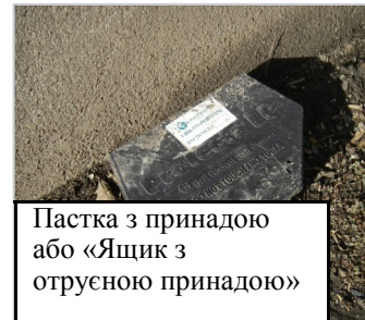
Пастка з принадою або «Ящик з отруєною принадою»

Пацюкову отруту завжди слід застосовувати у спеціальних захищених ящиках, щоб до неї не було доступу дітям та домашнім тваринам. Застосовувати тільки згідно з інструкціями на етикетці.