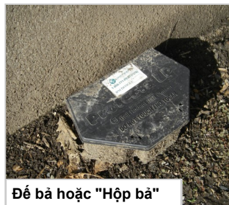
Đế bả hoặc "Hộp bả"

Bả chuột cống phải luôn luôn được đặt trong đế bả an toàn để cách ly chúng với trẻ nhỏ và vật nuôi. Chỉ sử dụng theo chỉ dẫn trên nhãn.