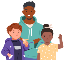
ልጆች እና ታዳጊዎች