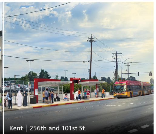
Kent | 256th and 101st St.