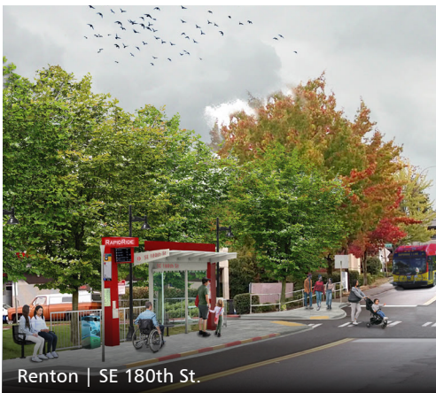
Renton | SE 180th St.