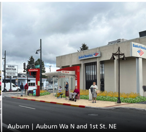
Auburn | Auburn Wa N and 1st St. NE